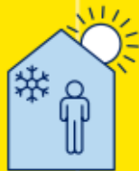
RESTEZ AU FRAIS